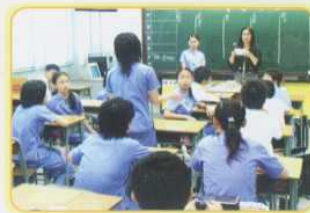
公民教育活動的「中華小狀元」