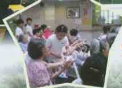
中大領袖發展計劃 ——探訪老人院