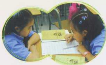
小老師替小一學生查考識字量