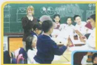
協作教學，角色扮演