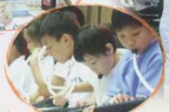
聯課活動： 聚精會神，用心聆奏