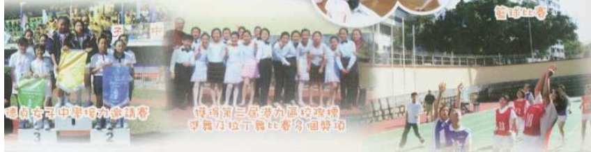
粵語女子中學場力能請譽