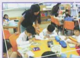
家長義工圖書管理員