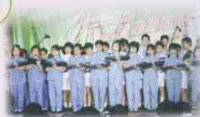
參加樂隊會歌活動