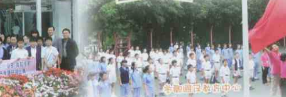
參加國際教育中心