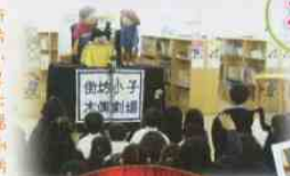
街坊小子才藝表演