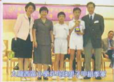
英國國際小學與聖瑪利子學校聯誼賽