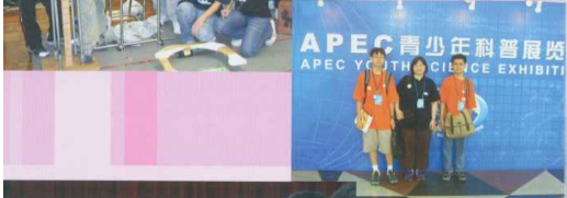
參加在北京舉行的亞太經合會組織青年科學館第二等獎