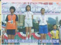
九龍西區小學田徑女子乙組跳高冠軍

本校學生在田徑、乒乓球、舞蹈、中、英及普通話朗誦、繪畫、書法、國畫、口風琴、敲擊樂及奧數比賽屢獲殊榮。