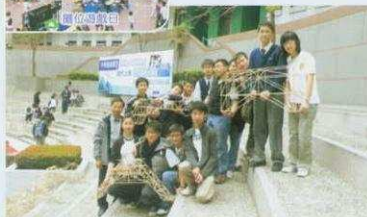
第四屆中學機械模型製作比賽