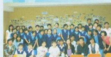
「共創成長路」團聯活動