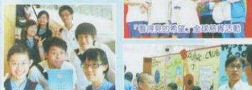
行政處與青年真情對話