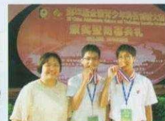
全港青少年科技創新大賽一等獎