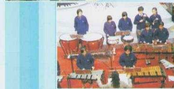
聖誕樂隊表演在又一城