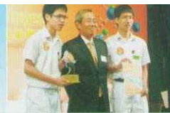
香港學生科學比賽 2007：冠軍及殿軍 少傑秀隊伍及最佳 演講獎