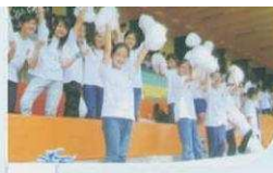
運動會開幕儀仗比賽