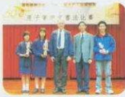
五十周年金禧校慶 原字軍中文書法比賽

在2006-2007學年，為加強學生運用英語的能力，本校曾推行下列活動，並取得滿意的成果。例如中六學生透過English Ambassadors培訓計劃，除於十月舉行萬眾慶祝活動外，並在課餘時間使用English Speaking Visa與初中同學交談。中一及中二同學曾參加English Demonstration Competition，中三及中四同學則參與English Mini Drama Competition。另外，本校亦致力推行Extensive Reading Scheme冀能幫助同學增強英語閱讀能力。