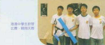
港澳中學生啟智比賽-聽用天際