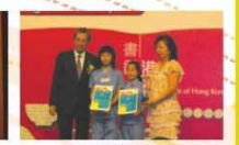
▲香港文學節文學作品演譯比賽小學組冠軍