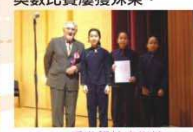
▲香港學校音樂節 敲擊樂大合奏比賽