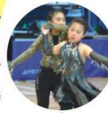
第44屆學校舞蹈節 牛仔舞甲等獎

英語話劇、口風琴、柔道、敲擊樂、繪畫、書法、國畫、圍棋、奧數、創意小玩具、中國民族舞、粵劇、普通話、乒乓球、籃球