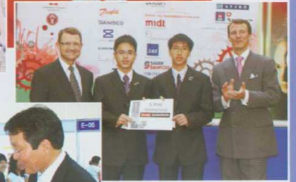
▲ 丹麥國家科學比賽奪冠 接受丹麥王子頒獎