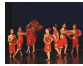
▲第44屆學校舞蹈節 中國民族舞甲等獎