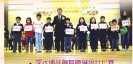
▲深水埔共融無障礙設計比賽

本校學生在田徑、乒乓球、舞蹈、中、英及普通話朗誦、繪畫、書法、國畫、口風琴、敲擊樂及奧數比賽屢獲殊榮。