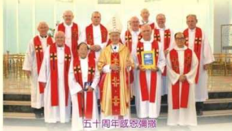
五十周年感恩彌撒