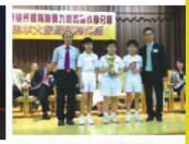
▲九西乒乓球男甲組亞軍