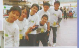
▲ FLL 機器人大賽