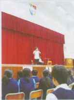
▲ 中一學生留校午膳後 參加午間中樂演奏會