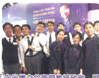
「向光鑑之父高錕教授致敬」展覽