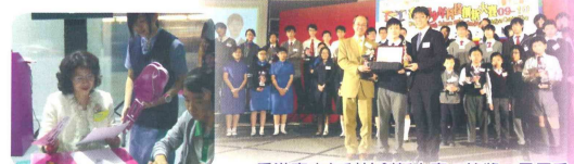
香港青少年科技創新大賽一等獎、最優秀項目獎及英特爾傑出電腦科學特別獎 參與創意機械臂活動