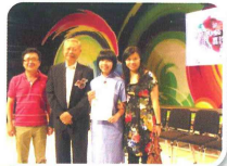
第二屆校園藝術大使嘉許禮

參觀、實地研習、社區服務、領袖訓練、體育競賽、藝術欣賞、攤位遊戲、興趣小組、學習分享等活動，發揮創意、展現潛能、擴闊視野、培養自信和責任感、認識自我和關心社會，並勇於面對挑戰，以達至全人發展的目標。