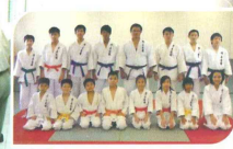
中小學生齊練習柔道