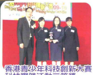
香港青少年科技創新大賽科技實踐活動三等獎