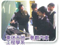
車迷天地—參觀汽車工程學系

內及校外的各項比賽外，學生會、四社、各學會及興趣小組均為同學提供多元化的課外活動。