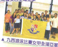
▲ 九西游泳比賽女甲全場亞軍