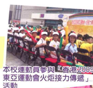
本校運動員參與「香港2009東亞運動會火炬接力傳遞」活動

趣味生活、十字繡、手工藝、小小科學家、棋藝、攪攪新意思、趣味泥膠、趣味小組遊戲、基督小先鋒、腦力大挑戰、ENGLISH CLUB、校園小記者、寫意水墨、普通話唱遊、話劇、創意小組、戲劇訓練班、幼童軍、合唱團、乒乓球、體操、排球、手球、羽毛球、小膠球、跳繩、康樂棋、瑪小園丁等。