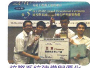
校際系統建模與優化競賽亞軍及良好表現獎