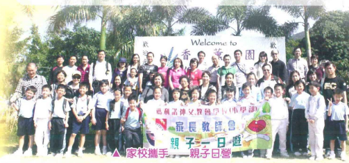
▲ 家校攜手——親子日營