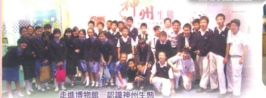
走進博物館—認識神州生態