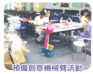
預備創意機械臂活動