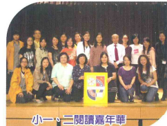
小一、二閱讀嘉年華