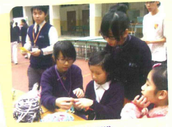
中學生教小學生編織