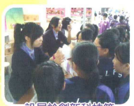
設展於創新科技節