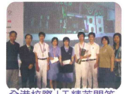
全港校際 I.T. 精英問答比賽亞軍