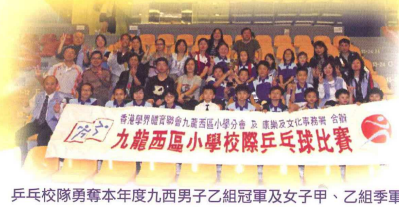
乒乓球校隊勇奪本年度九西男子乙組冠軍及女子甲、乙組季軍

英語話劇、體育舞蹈、乒乓球校隊、足球興趣班、籃球校隊、口風琴、<鏡子>培訓班、世界文化之旅、圍棋、普通話、敲擊、民族舞、奧數、社交小組、配音、英粵劇、繪畫、書法、國畫、Lego小玩具、排球、Lego機械人等。