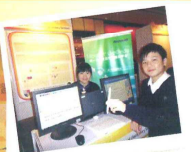
同學幫忙演示得獎之教學法