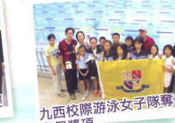
九西校際游泳女子隊奪得多個獎項