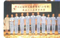
第五十三屆畢業典禮