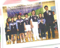
▲ 林大輝中學乒乓球比賽