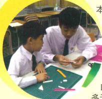
中學生教小學生編機械臂

本校中小學部關係密切，經常合辦各類活動，讓中學生能從中發揮領導才能及加強對社會的承擔，並協助小學生適應未來的中學生生活及培養多元智能的發展。