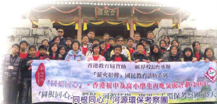
香港教育局資助「新界校區會承辦「薪火相傳」國民教育活動系列 「同根同心」—香港初中及高小學生內地交流計劃(2009) 「同根同心·同根同心」河源環保考察團