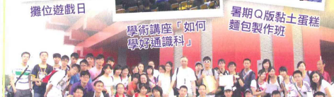
學術講座「如何學好通識科」