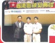
全國賽科技實踐活動二等獎