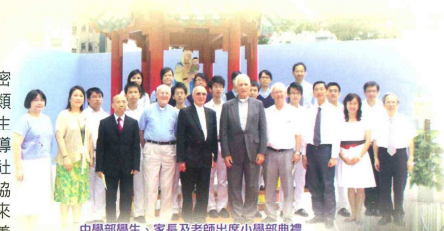
中學部學生、家長及老師出席小學部典禮

本校中小學部關係密切，經常合辦各類活動，讓中學生能從中發揮領導才能及加強對社會的承擔，並協助小學生適應未來的中學生生活及培養多元智能的發展。