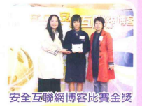
安全互聯網博客比賽金獎