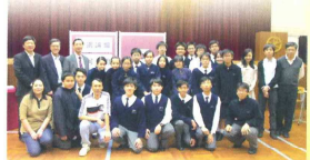
校友會、家長教師會代表出席校園論壇

校友會積極聯絡本港及海外校友，舉辦聚會及球賽等，以維繫情誼。在溫哥華及多倫多等地，均已成立分會。校友會關心母校的發展，協助籌辦多項大型活動，募集