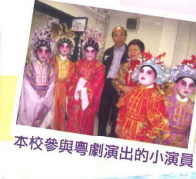
本校參與粵劇演出的小演員