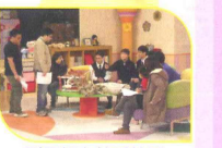
到電視台接受訪問