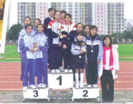
▲ 中聖書院校友校接力邀請賽