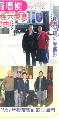
比賽主場外館留影