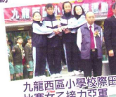
九龍西區小學校際曾經比賽女乙接力亞軍