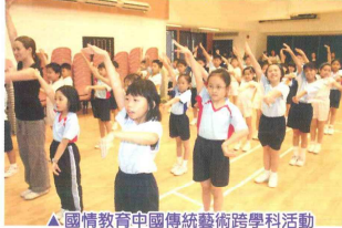
▲ 國情教育中國傳統藝術跨學科活動