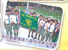
本校童軍獲選九龍地域傑出旅團