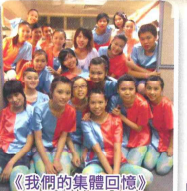
《我們的集體回憶》現代舞培訓計劃