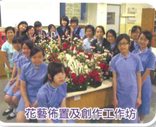
花藝佈置及創作工作坊