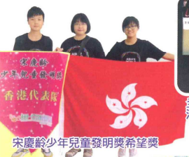
宋慶齡少年兒童發明獎希望獎