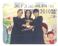
室內空氣質素網頁設計比賽冠軍