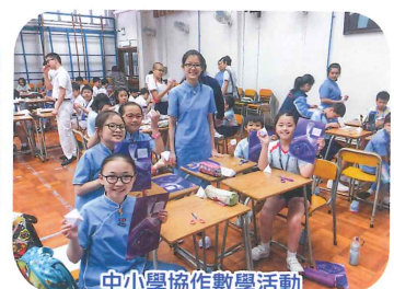
中小學協作數學活動