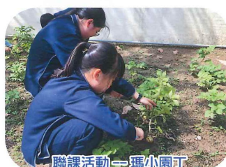
聯課活動—瑪小園丁