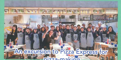
An excursion to Pizza Express for pizza-making