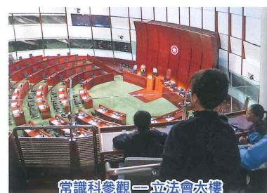
常識科參觀—立法會大樓