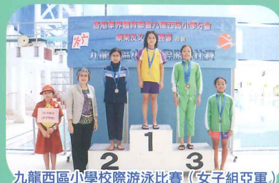
九龍西區小學校際游泳比賽(女子組亞軍)