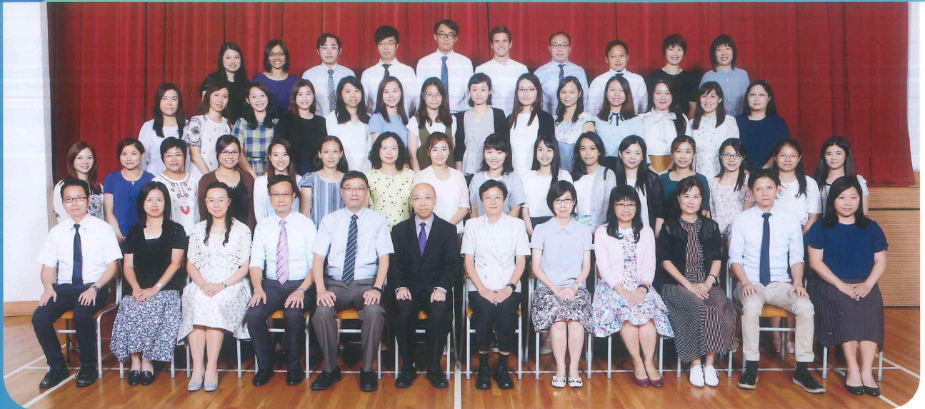
小學部全體教師合照