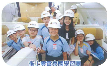
衝上雲霄泰國學習團