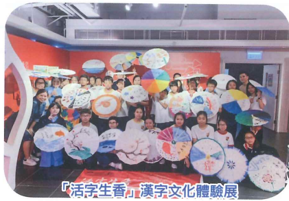
『活字生香』漢字文化體驗展