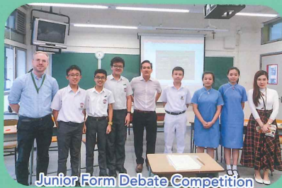
Junior Form Debate Competition