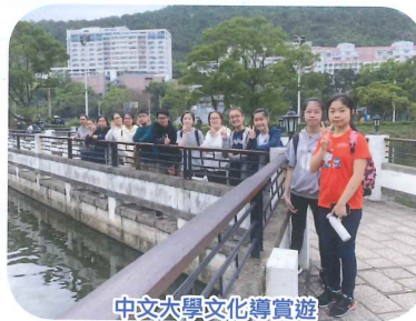
中文大學文化導賞遊