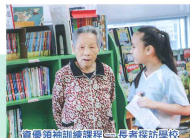
資優領袖訓練課程—長者探訪學校