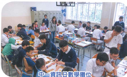
中一資訊日數學攤位