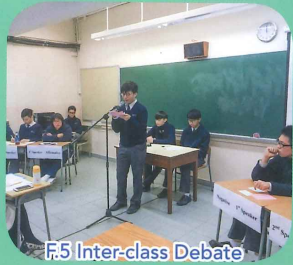
F.5 Inter-class Debate