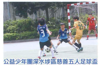
公益少年團深水埗區慈善五人足球盃