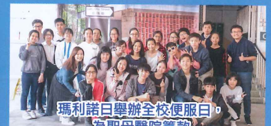
瑪利諾日舉辦全校便服日 為聖母醫院籌款