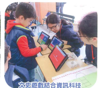
文史遊戲結合資訊科技