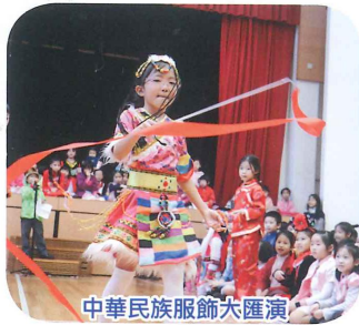
中華民族服飾大匯演