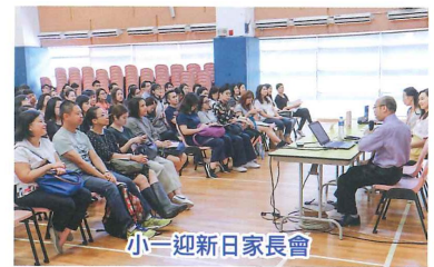
小一迎新日家長會