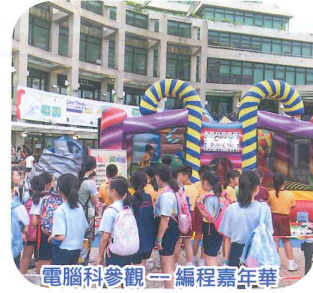
電腦科參觀—編程嘉年華