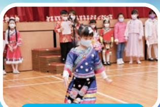
中華民族服飾大匯演