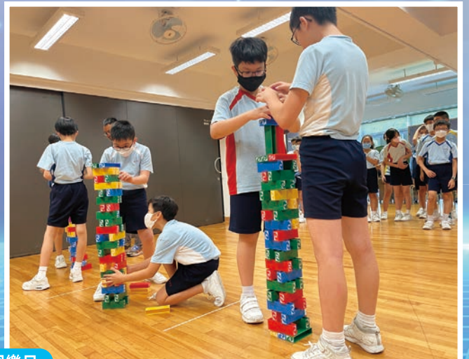
校友會少青會員同樂日