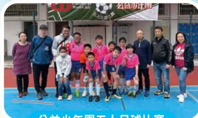
公益少年團五人足球比賽