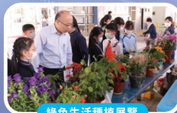
綠色生活種植展覽