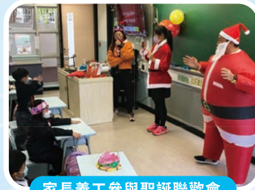
家長義工參與聖誕聯歡會