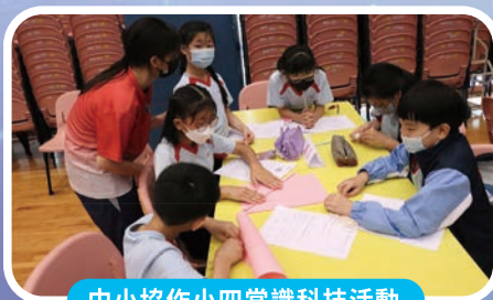
中小協作小四常識科技活動