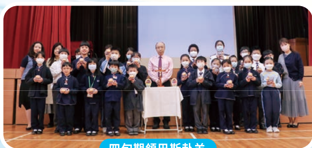
四旬期領巴斯卦羊