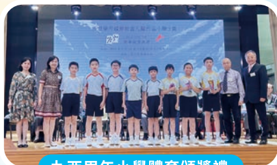
九西周年小學體育頒獎禮