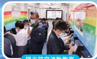
陽光笑容流動教室