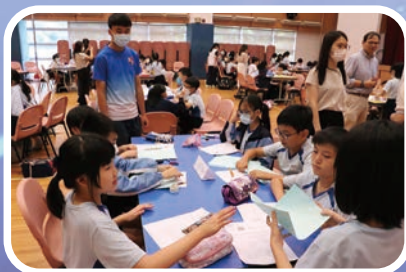
中小協作小四常識科技活動

本校與中學部為直屬學校關係，經常合辦各類活動，讓中學生能從中發揮領導才能及加強對社會的承擔，並協助小學生適應未來的中學生活及培養多元智能的發展。