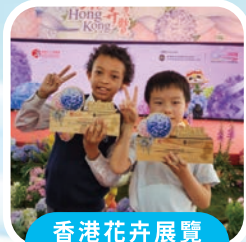
香港花卉展覽 種植展品比賽