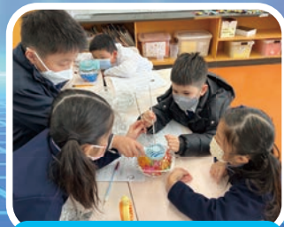
STREAM & Dream Days