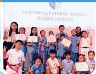
《地球之聲挑戰賽 2023》歌唱比賽冠軍

本校學生在田徑、球類、游泳、舞蹈、戲劇、中、英及普通話朗誦、STREAM、繪畫、書法、合唱、打擊樂及奧數比賽屢獲殊榮。